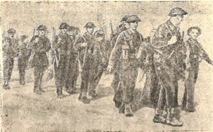
На снимке: Солдаты английского военно-воздушного полка продвигаются в Мэзон-бланш (Альжир) для занятия аэродрома.