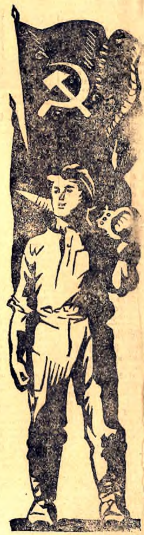
Подхватывайте почин передовиков, вступайте в соревнование! Больше продукции для фронта! Помогите Красной Армии громить ненавистного врага.

Коллектив принял обязательство выполнить план по ассортименту за 1942 год не менее, чем на 105 процентов, снизить брак по отношению к I кварталу на 5 процентов, поднять производительность труда на 10 процентов, дать экономии материалов на 5 процентов, между цехами, сменами, бригадами и отдельными рабочими заключить социалистические договоры.