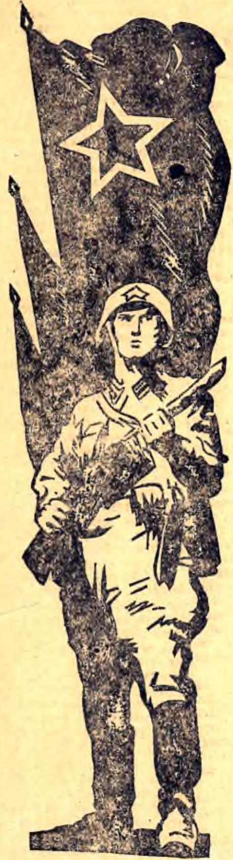
За советскую отчизну идут в бой миллионы народов Советского Союза. Иа здравствует Красная Армия — миллиарды братьев и друзей народов всего мира!

Боевыми делами ответим на призыв кировцев, сделаем все, чтобы помочь Красной Армии выполнить первомайский приказ товарища Сталина