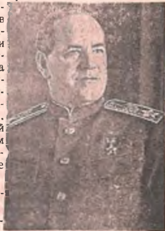
Маршал Советского Союза Г. К. ЖУКОВ

За образцовое выполнение боевых заданий Верховного Главнокомандования по руководству операциями на фронте борьбы с немецкими захватчиками в районе Берлина и достигнутые в результате этих операций решающие успехи наградить Героя Советского Союза Маршала Советского Союза Жукова Георгия Константиновича третьей медалью „Золотая звезда“. Соорудить бронзовый бюст с изображением награжденного и установить его на постаменте в городе Москве.