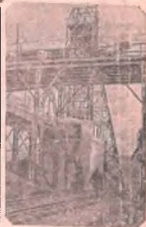
Мощная шахта „Гигант“, восстановленная в Криворожском бассейне.

Время не ждет. Организованно проведем нашу помощь коммунальному отделу в подготовке к зиме.