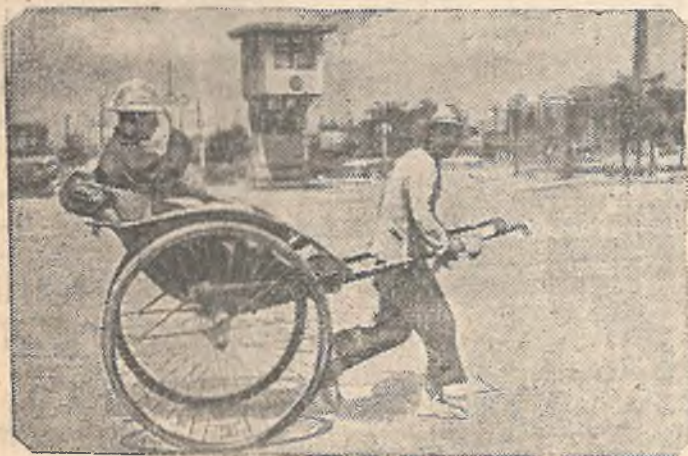
Китаец-рикша на улицах г. Дальний В.