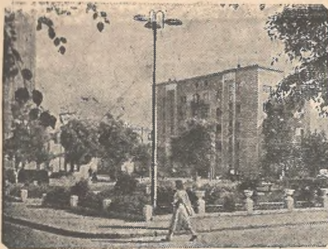
Днепрострой. Одна из улиц поселка Днепростроя.