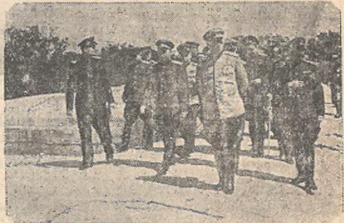
В Порт-Артуре. Представителя Советского Военного Командования во главе с Маршалом Советского Союза Василевским осматривают исторические места обороны русскими крепостя Порт-Артур в 1904 году (15-ая батарея на Электрическом утесе).

Социалистическое соревнование должно преследовать не только увеличение выпуска продукции, но и повышение ее качества.