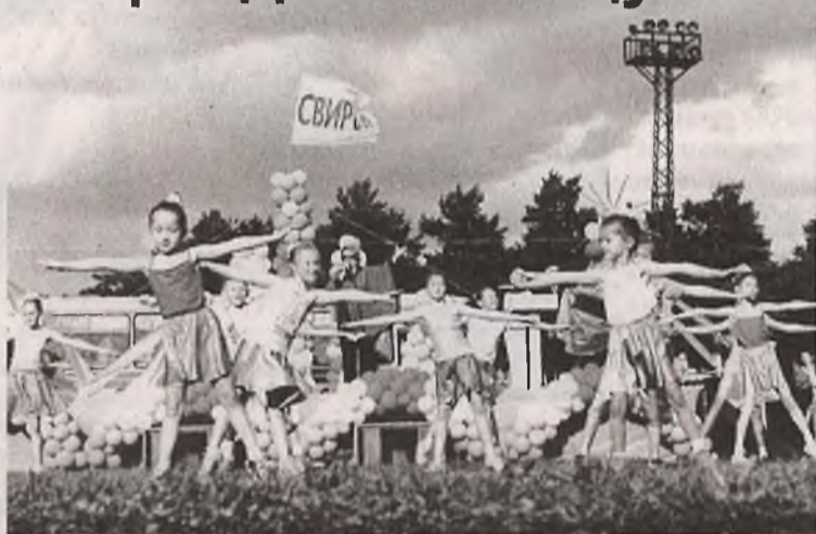
Своими впечатлениями о Дне города делятся наши корреспонденты на стр. 2-3

Живи и здравствуй, Свирск родной, А в праздники танцуй и пой!