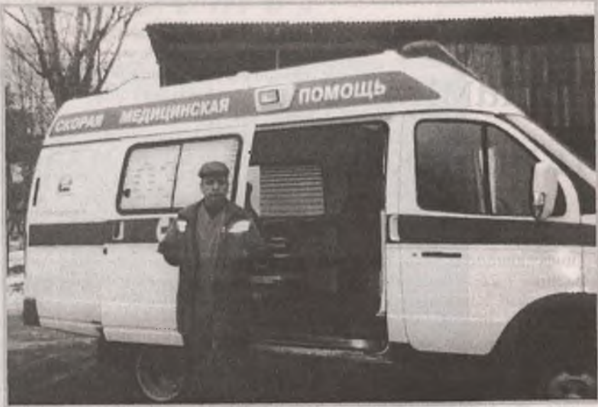
Текст и фото Е. Гузовой

Автопарк отделения «Скорой помощи» пополнился еще одним санитарным автомобилем. Эта машина даже более усовершенствованная, с большими возможностями, чем предыдущая. И это отмечает медперсонал, который на вызовы теперь выезжает на новой нестложке. Дежурный фельдшер М.Н.Ильченко охотно разрешил сфотографировать себя на фоне новой машины.