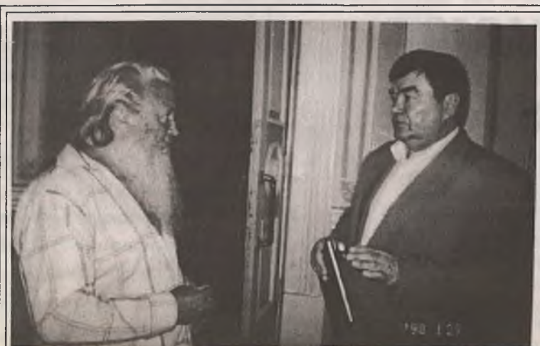
После отчета общение продолжилось в фойе.

и о многом другом спрашивали свирчане мэра города